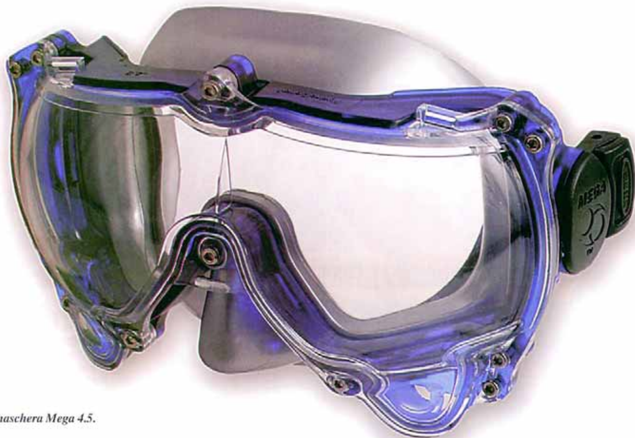
La maschera Mega 4.5.